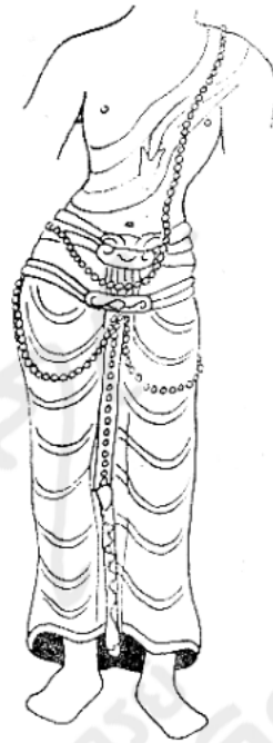
ภาพลายเส้นที่ ๕

พระโลกนาถ เลขที่ B (d) 1 ที่พิพิธภัณฑ์เมืองสวารนาถ ศิลปอินเดียสมัยคุปตะ