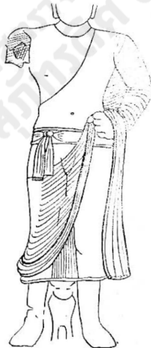
ภาพลายเส้นที่ ๒

พระโพธิสัตว์อวโลกิเตศวรเลขที่ B-82 พิพิธภัณฑสถานเมืองลัคเนา ศิลปอินเดียสมัยมถุรา