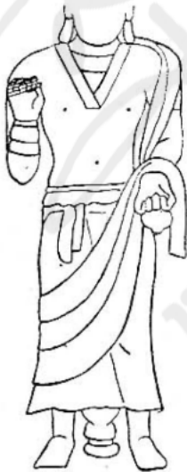
ภาพลายเส้นที่ ๑

๑. ผ้าทรง ในศิลปะสมัยมถุรา (รูปที่ ๒ และภาพลายเส้นที่ ๑) ผ้าทรงหรืออันตราสกแทนที่จะห้อยลงมาเป็นชายค้งในรูปพระโพธิสัตว์สมัยคันธาระ เบื้องล่างก็ตัดเป็นเส้นตรง