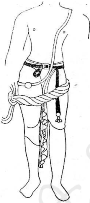
ภาพลายเส้นที่ ๘ พระโลกนาถที่มหาวิทยาลัยนาลันทา ศิลปะอินเดียสมัยปาละ-เสนะ