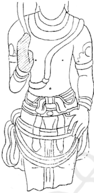
ภาพถ่ายเส้นที่ ๗ พระโพธิสัตว์อวโลกิเตศวรที่เมืองอมราวดี ศิลปอินเดียสมัยหลังคุปตะ

(ภาพถ่ายเส้นที่ ๗) การคาดผ้าคลุมแบบนี้มีปรากฏอยู่ที่ถ้ำเอลโลราด้วย เช่นที่ถ้ำไกรลาสและที่ถ้ำที่ ๑๒ หรือถ้ำดินถลน