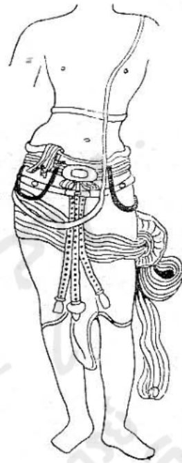
ภาพลายเส้นที่ ๕ พระโลกนาถในพิพิธภัณฑ์บริติช กรุงลอนดอน ศิลปะอินเดียสมัยปาละ-เสนะ

โพธิสัตว์ สิ่งนี้เห็นได้ชัดจากการที่บนผ้าห่มของพระโพธิสัตว์อวโลกิเตศวร บางครั้งเราก็เห็นมี ศิวะกวางปรากฏอยู่ เช่นบรรดารูปพระอโมฆบาท (รูปที่ ๑๖ และ ๒๐) รูปพระสุคติสังฆารศน- โลกเศวตสมัยแรก (รูปที่ ๒๒) และรูปพระสิงหาสน์โลกเศวตสมัยฟื้นฟู (รูปที่ ๓๔) ดังนั้นการ ครองผ้าห่มโดยเปิดขาขวาจึงมีมาตั้งแต่ต้นจนถึงปลายศิลปะสมัยปาละ-เสนะ และยังคงอยู่ใน ศิลปะเนปาลจนถึงพุทธศตวรรษที่ ๒๒ โดยที่ไม่มีการเปลี่ยนแปลงอะไรเลย