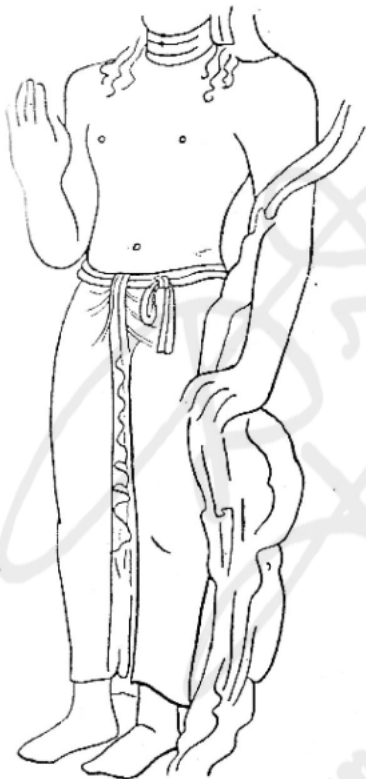
ภาพลายเส้นที่ ๓ พระโพธิสัตว์อวโลกิเตศวรปางปฎิหารย์ ที่ถ้ำเอราวัณภาพที่ ๑ ศิลปะอินเดียสมัยหลังคุปตะ

ในแคว้นมหाराษฎร์ในสมัยคุปตะและหลังคุปตะ รูปพระโพธิสัตว์มักจะทรงแต่ผ้าทรงเท่านั้น พระองค์ก่อนบนเปลือยเปล่า ผ้าทรงนี้มีสายรัดองค์ทำค้วยเชือกคาคอยู่ (รูปที่ ๖,๗ และภาพลายเส้นที่ ๓) สายรัดองค์ที่ทำค้วยผ้าและมีหัวทำค้วยเพชรพลอยนั้นดูเหมือนจะเกิด