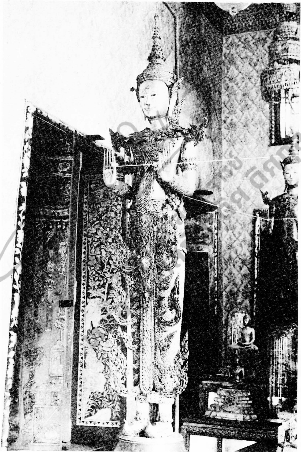
รูปที่ ๓ พระพุทธรูปยืนอยู่ด้านหน้า พระพุทธรูปจูลงจั่งอยู่ด้านหลัง ในหอพระสุราลัยพิมาน พระบรมมหาราชวัง