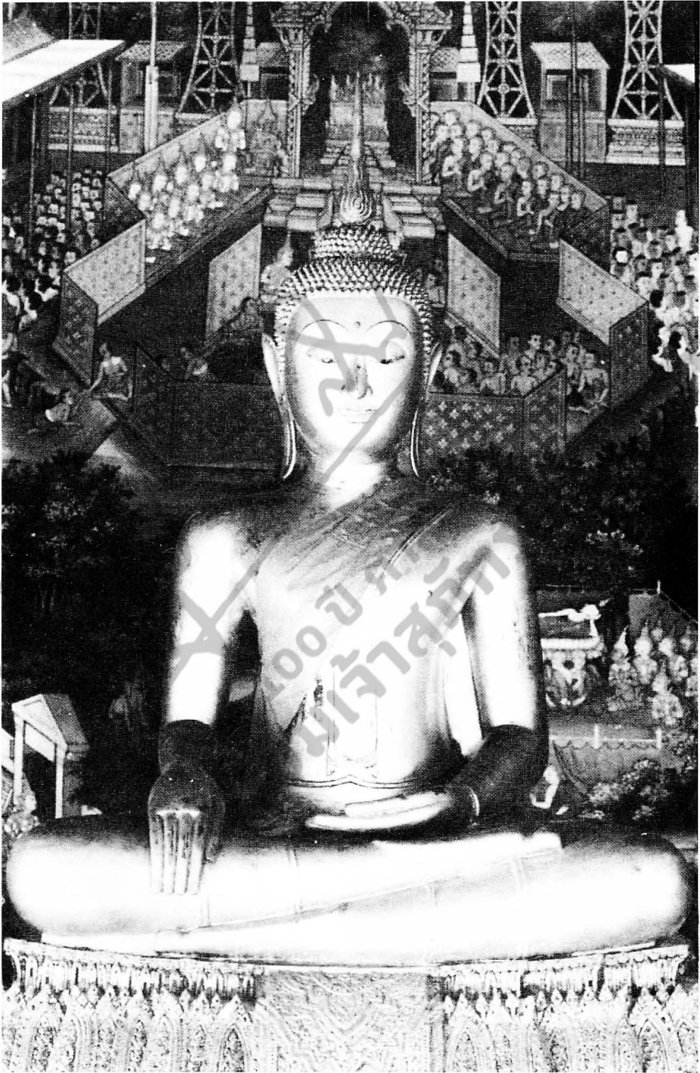
รูปที่ ๕ พระพุทธธรรมิกราช พระประธานในพระอุโบสถวัดอรุณฯ