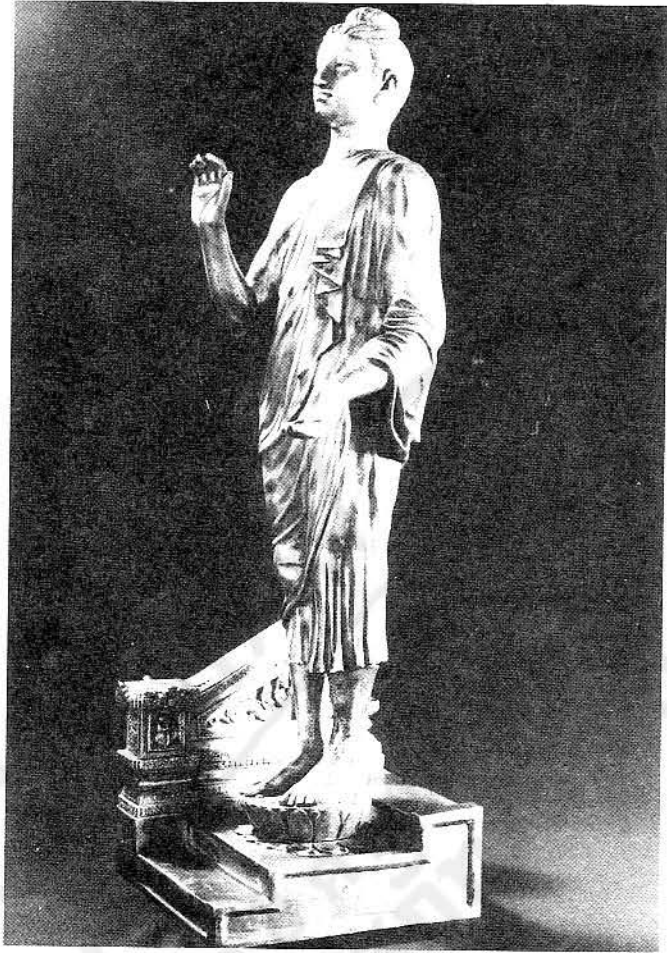
รูปที่ ๕ พระพุทธรูปคันธารราช ปางขอฝน ในสมัยรัชกาลที่ ๕

สำหรับพระพุทธรูปสำคัญในรัชกาลที่ ๔ ยังมี อีกดังต่อไปนี้คือ พระพุทธรูปนฤมิต เป็นพระยืนทรง เครื่อง ประดิษฐานอยู่ที่บุษบกหน้าพระอุโบสถวัด อรุณฯ พระบาทสมเด็จพระจอมเกล้าเจ้าอยู่หัวทรง สร้างจำลองจากพระพุทธรูปจำลองพระองค์รัชกาล ที่ ๒ ในหอพระสุราลัยพิมานดังกล่าวมาแล้ว โดยมี พระราชประสงค์จะเชิญไปประดิษฐานไว้ที่ บุษบกนั้น แต่ยังหาได้เชิญไปไม่ พระบาทสมเด็จพระ จุลจอมเกล้าเจ้าอยู่หัวโปรดฯ ให้เชิญไปประดิษ ฐานเมื่อ พ.ศ. ๒๔๓๙ นอกจากนี้ก็มีพระพุทธรูปหิ นคากรซึ่งเป็นพระประธานในวัดราชประดิษฐ์ โปรดฯ ให้หล่อจำลองจากรูปพระพุทธรูปหิ