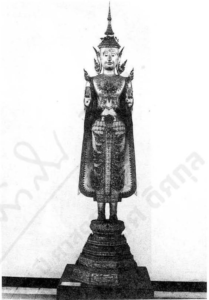
รูปที่ ๘ พระพุทธรูปทรงเครื่อง สมัยรัชกาลที่ ๔ ในพิพิธภัณฑสถานแห่งชาติ

ธรรมวินัยนั้นก็รุ่งเรืองเจริญมากขึ้น ควรจะมีสิ่งซึ่ง เป็นสำคัญสำหรับเป็นที่ระลึกสืบไปใน พ.ศ. ๒๔๑๑ จึงทรงพระกรุณาโปรดเกล้าฯ ให้ช่างหล่อพระพุทธรูป พิมพ์เดียวกันกับพระนิรันตรายทองและเงินด้วย ทองเหลืองแล้วกะไหล่ด้วยทองคำ มีเรือนแก้วเป็น พุ่มพระมหาโพธิ์อยู่เบื้องหลัง มีอักษรขอมจำหลัก ลงในวงกลีบบัว เบื้องหน้า ๕ เบื้องหลัง ๕ เป็นพระ คุณนามแสดงพระพุทธรูปคุณตั้งแต่ อรหิ สมุสาสม พุทฺโธ จนถึง ภควา บนเรือนแก้วเหนือพระพุทธรูป มีรูปพระมหามงกุฎ เรือนแก้วนี้ตั้งติดอยู่กับฐาน ชั้นล่าง โปรดฯ ให้หล่อขึ้นครั้งแรก ๑๘ องค์ เท่า กับจำนวนปีซึ่งได้เสด็จดำรงสิริราชสมบัติ แล้วทรง