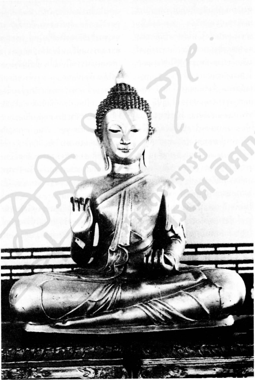
รูปที่ ๑ พระคันธารราษฎร์ ปางขอฝน สมัยรัชกาลที่ ๑ ในหอพระคันธารราษฎร์ วัดพระศรีรัตนศาสดาราม