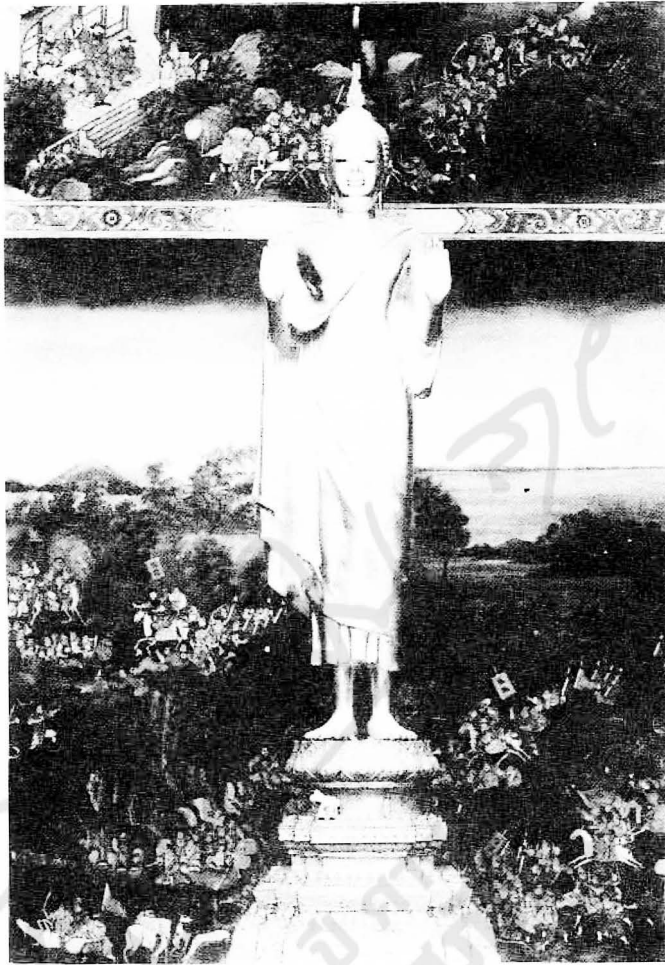
รูปที่ ๑๒ พระพุทธมุนัสสาก ในวิหารเก๋ง วัดบวรนิเวศวิหาร

พระยืนทรงเครื่องอย่างจักรพรรดิราช (รูปที่ ๑๐) พระบาทสมเด็จพระจุลจอมเกล้าเจ้าอยู่หัวโปรดฯ ให้สร้างขึ้น ทรงพระราชอุทิศถวายสมเด็จพระบรมชนกนาถคือพระบาทสมเด็จพระจอมเกล้าเจ้าอยู่หัว โดยฐานที่ได้เคยทรงครองวัดบวรนิเวศ ปิดทองเสร็จแล้วเชิญไปประดิษฐานไว้ ณ วิหารเก๋งด้วยกันกับพระพุทธรูปญาณอัตกะ แล้วมีการสมโภช ๓ วัน เมื่อ พ.ศ. ๒๔๒๕ พระพุทธรูปญาณอัตกะเป็นพระยืนคลุมจีวรสองพระองค์ (รูปที่ ๑๑) พระบาทสมเด็จพระจุลจอมเกล้าเจ้าอยู่หัวโปรดฯ ให้สร้างขึ้น ทรงอุทิศถวายสมเด็จพระมหาสมณเจ้า กรมพระยาปวเรศวริยาลงกรณ์พระบรมราชาอุปถัมภ์