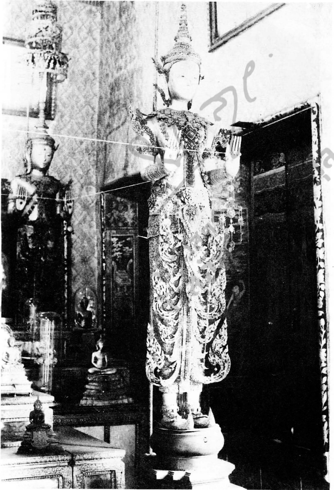
รูปที่ ๕ พระพุทธรังสฤษดิ์อยู่ด้านหน้า พระพุทธจักรพรรดิอยู่ด้านหลัง ในหอพระสุราลัยพิมาน พระบรมมหาราชวัง