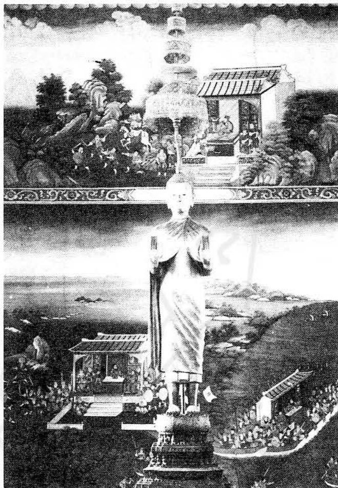
รูปที่ ๑๑ พระพุทธรูปปัญญาอัคคะ ในวิหารเก๋ง วัดบวรนิเวศวิหาร

ในสมัยรัชกาลที่ ๕ (พ.ศ. ๒๔๑๑-๒๔๕๓) ได้เสด็จพระราชดำเนินไปประพาสประเทศอินเดีย เมื่อ พ.ศ. ๒๔๑๘ ขณะนั้นเป็นเวลาที่นักปราชญ์ชาวต่างประเทศกำลังค้นคว้าเกี่ยวกับกำเนิดของพระพุทธรูปเป็นรูปมนุษย์และลงความเห็นว่าเป็นพระพุทธรูปรุ่นแรกชาวกรีก-โรมันเป็นผู้คิดค้นขึ้นก่อนและเรียกศิลปะแบบนั้นว่าศิลปะแบบคันธารราชูตามชื่อถิ่นกำเนิดคือแคว้นคันธาระทางทิศตะวันตกเฉียงเหนือของประเทศอินเดีย เมื่อเสด็จกลับมาแล้วจึงโปรดฯ ให้หล่อพระพุทธรูปคันธารราชูปางขอฝนขึ้น เป็นพระพุทธรูปยืนตามแบบศิลปะกรีก-โรมัน คือ มีพระเกศาเหมือนเส้นผมคนธรรมดาและมีมวยพระเกศา