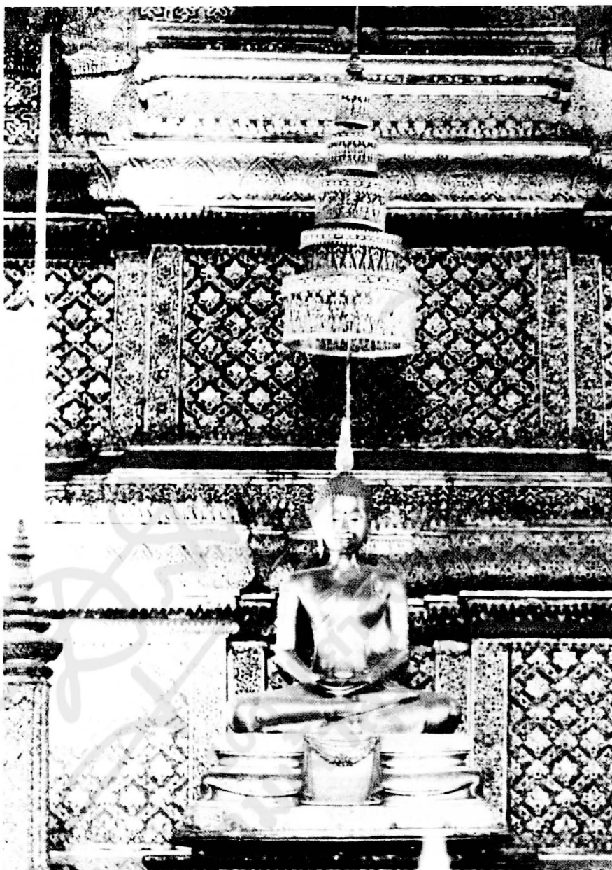
รูปที่ ๖ พระสัมพุทธพรรณี สมัยรัชกาลที่ ๔