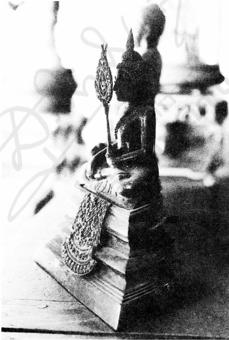
รูปที่ ๑๔ พระชัย ในหอพระสุราลัยพิมาน พระบรมมหาราชวัง

พระชัยวัฒน์และพระแก้วที่กล่าวมาข้างต้น ส่วนใหญ่ปัจจุบันประดิษฐานอยู่ในหอพระสุราลัยพิมานในพระบรมมหาราชวัง เป็นอันจบเรื่องพระพุทธรูปสำคัญสมัยรัตนโกสินทร์แต่เพียงเท่านี้