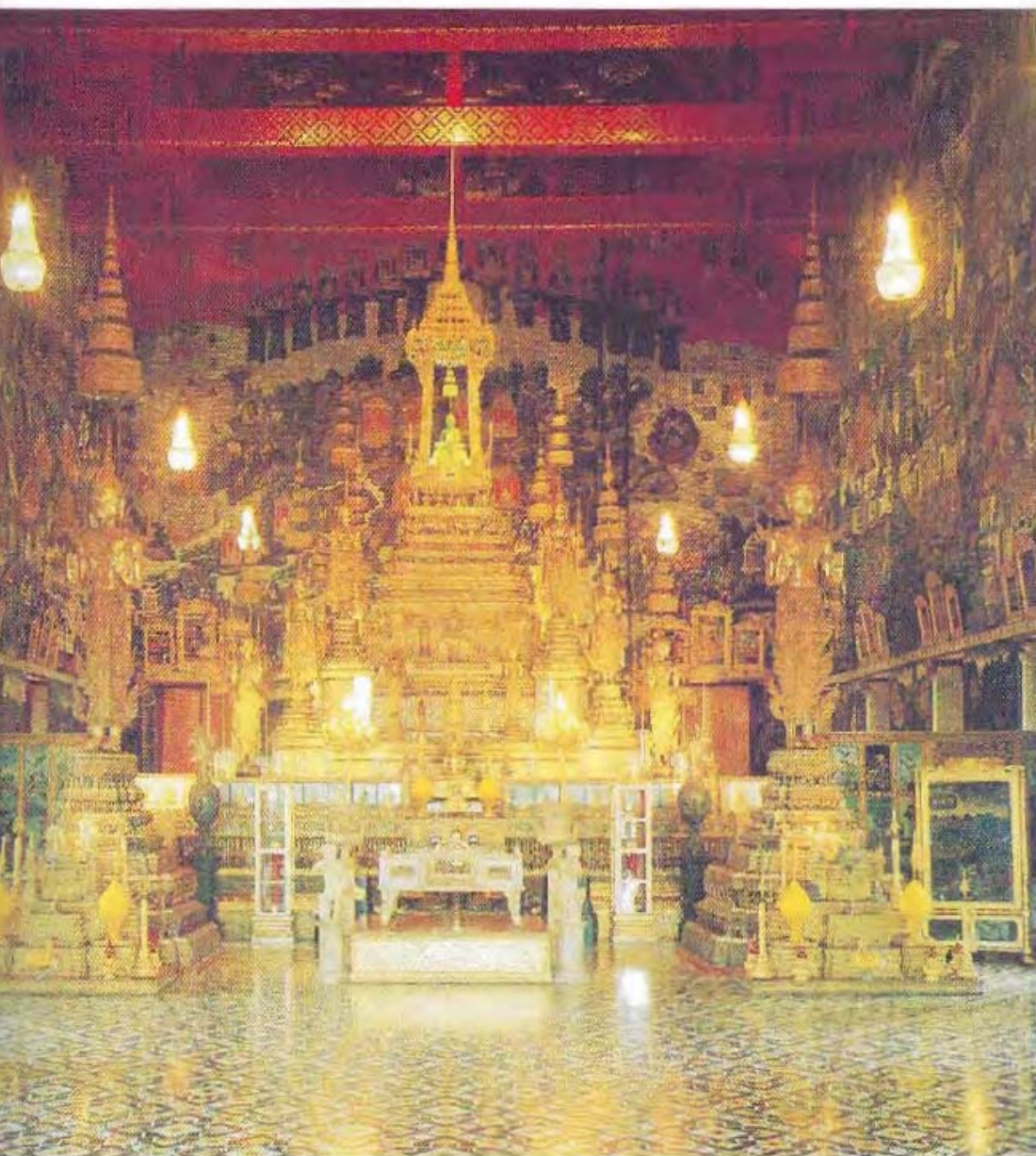
๑. ภายในพระอุโบสถวัดพระศรีรัตนศาสดาราม พระแก้วมรกตทรงเครื่องกุดฝั้น