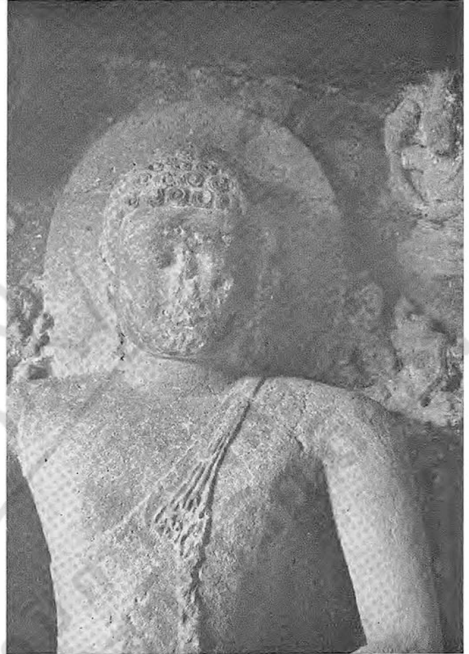
๕. พระพุทธรูปประทับนั่ง ในถ้ำเอลโลราที่ ๑๒ ศิลปินเดี่ยวแบบ หลังคุปตะ