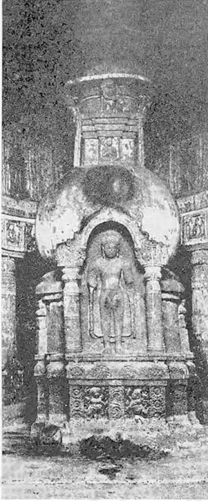
๒. พระพุทธรูปประทับยืนบนสதுปภายใต้อำ อรัญค้ำที่ ๑๕ ศิลปอินเดียแบบหลังคุปตะ