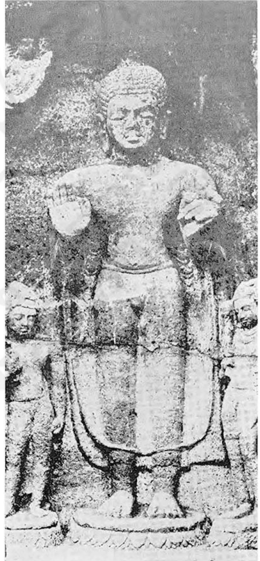
๓. พระพุทธรูปยืนปางประทานอภัย ภายใต้อำ อรัญค้ำที่ ๒๖ ศิลปอินเดียแบบหลังคุปตะ