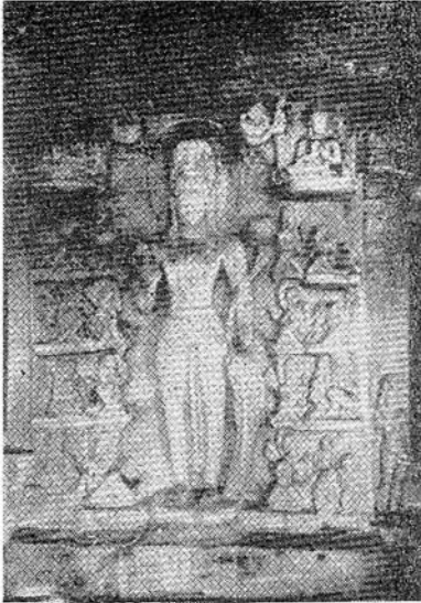
รูปที่ ๖ พระโพธิสัตว์อวโลกิเตศวรปางปาฏิหาริย์ ถ้ำเขาจริงลาพาทที่ ๑ ศิลปะอินเดียสมัยคุปตะในแคว้นมหาราษฎร์