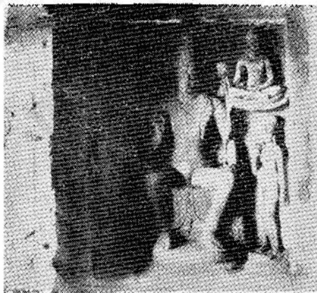
รูปที่ ๘ พระโพธิสัตว์อวโลกิเตศวรผู้ยิ่งใหญ่ ถ้ำเอลโดราที่ ๔ ศิลปะอินเดียสมัยหลังคุปตะในแคว้นมหาราษฎร์